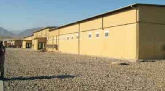
Baza „Marmal” u Mazar e Sharifu

primjer, pored infrastrukturnih ulaganja organizovane su i rade kancelarije guvernera distrikata i policijske stanice u svim distriktima. Međunarodna zajednica želi da Avganistanci sami brinu o svojim projektima, sa ciljem da budu uključeni u sve nacionalne potrebe i da znaju koja su očekivanja od Avganistana.