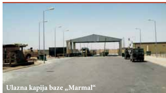
Ulazna kapija baze „Marmal”

Crnogorski oficiri su u pripremi za učešće u misiji završili potrebnu obuku i time stekli neophodna znanja i vještine. Izvršavanjem zadataka u okviru Regionalne komande unaprijediće i znanja i steći dragocjeno is-