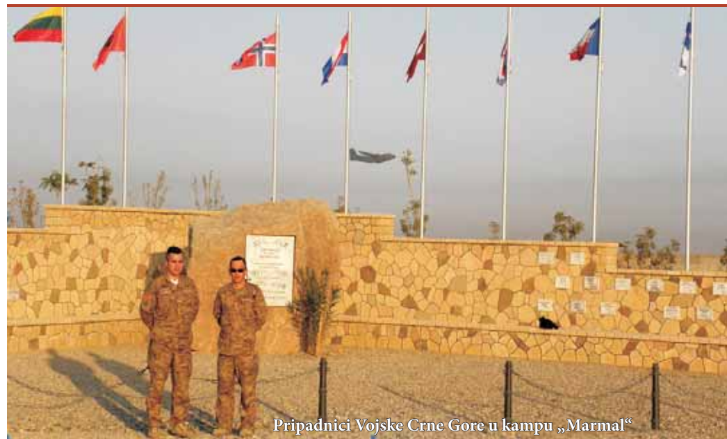
Pripadnici Vojske Crne Gore u kampu „Marmal”

vima izdvajaju kao neminovan, dominantan i sve značajniji oblik vojnog angažovanja. Primjena djelovanja snaga za izvođenje ovih operacija u postizanju ciljeva pratio je izrazito brz i veoma širok razvoj i primjena sredstava javnog komuniciranja. Psihološke operacije se izvode na duži i kraći vremenski period. Operacije se izvode uz poštovanje principa, od kojih su posebno značajni: jasna definicija misije koja se sprovodi, koordinacija aktivnosti, ažurnost i pravovremenost, istinitost sa empirijskim podacima, javnost izvora i kredibilitet. Takođe je od posebnog značaja oba-